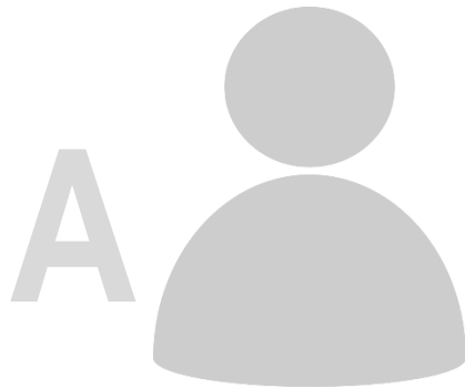
PESSOA SINGULAR EM EDIFÍCIO DE HABITAÇÃO